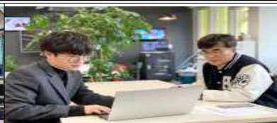
원스톱 창업멘토링 지원