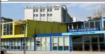
코맥스 스타트업 타운 (창업자 전용, 공용 공간)