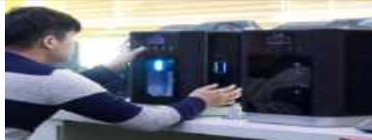
3D 프린터 등